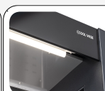
Luce interna LED