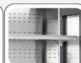
Ripiani in acciaio appoggiati su blocchi ancorati alle spalle